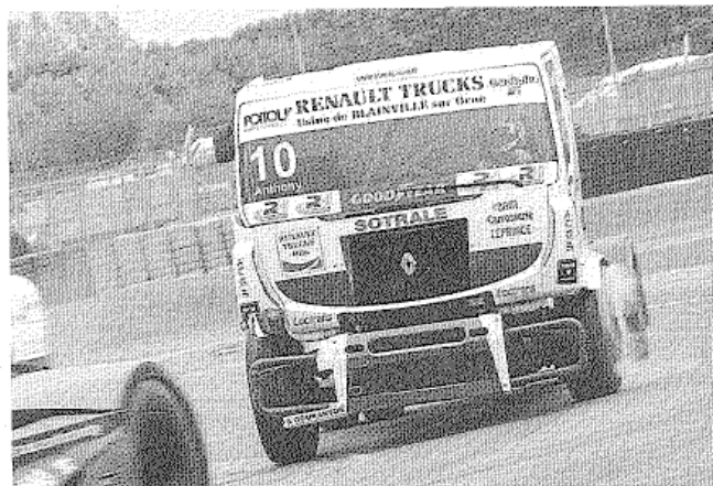
Anthony Janiec se classe 4 e de la course 4 du championnat d'Europe FIA.

Championnat d'Europe FIA. Course 3 : 1. Ostreich (Renault) ; 2. Hahn (Man) ; 3. Lacko (Renault) ; 4. Janiec (Renault) ; 5. Bosiger (Renault) ; 6. Levett (Freightliner)... 10. Robineau (Man)... 15. Orsini (Mercedes). Course 4 : 1. S. Bosiger (Renault) ; 2. Kiss (Man) ; 3. Ostreich (Renault) ; 4. Janiec (Renault) ; 5. Hahn (Man) ; 6. Levett (Freightliner)... 11. Robineau (Man)... 17. Orsini (Mercedes).